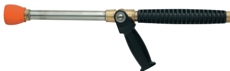
22.1617.11 sotto insieme lavaggio washing subassembly