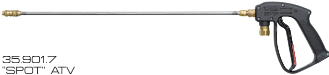
35.901.7 "SPOT" ATV