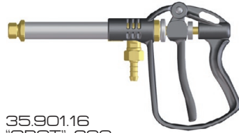
35.901.16 "SPOT" 300