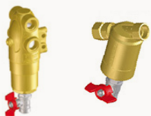
FILTRI M144 - M146

Strumento di misura per il controllo dell'erogazione dei singoli ugelli su irroratrici in banda e atomizzatori. Modello inclinabile, telaio in acciaio inox e ruote per facilitarne il trasporto.