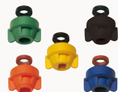
GHIERE ZIP FIT Guarnizioni in EPDM e FPM