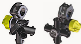
M283 - M286