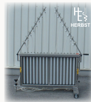
BANCO PROVA HERBST® ED 16-2 LK

Strumento di misura per il controllo dell'erogazione dei singoli ugelli su irroratrici in banda e atomizzatori. Modello inclinabile, telaio in acciaio inox e ruote per facilitarne il trasporto.