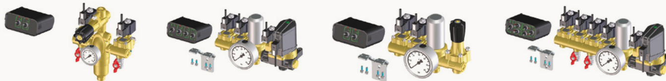
GRUPPI M200 ASSEMBLATI: Gold - Silver - Platinum - Titanium