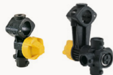
ZIP FIT - QUADRIFIT