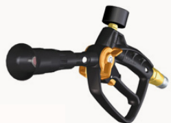
Lancia Nehro T Con manometro e girevole