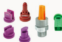
UGELLI HYPRO® Linea Completa