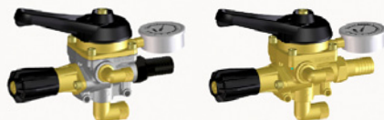
COMANDI M170 - M170 OT

Per richiedere un'offerta o avere più informazioni: