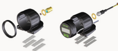
PRESS MATE M - D