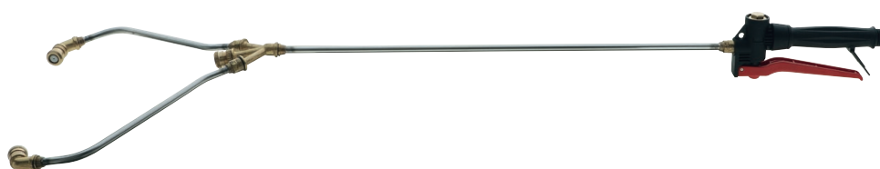
3.901.8 SCARABEO / SCARAB