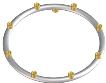
MANICOTTI E ATTACCO SALDATI WELDED SLEEVES AND CONNECTION